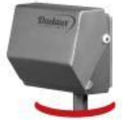
Schutz des Bildschirms gegen unter Druck stehendes Spritzwasser