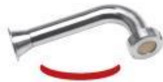
Verfügbare Option Füllrohre gebogen mit Antitropf- Ventil zum Füllen von Verrinen, Dosen, usw.