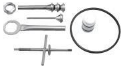
Zubehör aus Edelstahl 18/10