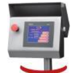
Touchscreen Einfache und angenehme Programmierung