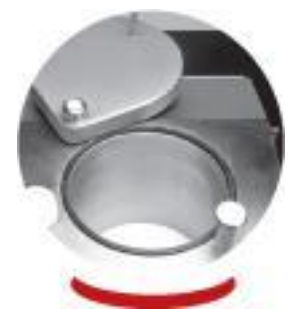
Zylinder 32 Liter