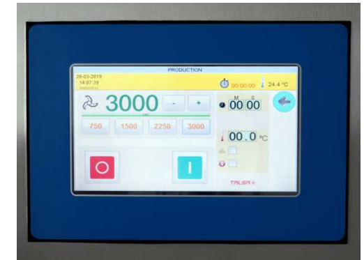
Digitaler 7" Touchscreen.