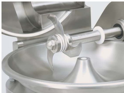
Abnehmbarer Messerkopf mit 3 Qualitätsmessern. (Standard)