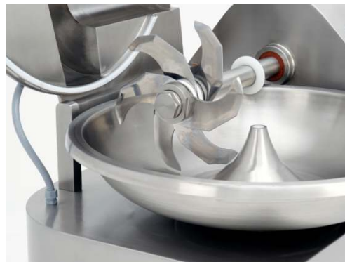
Optional: Messerkopf mit 6 Messern.