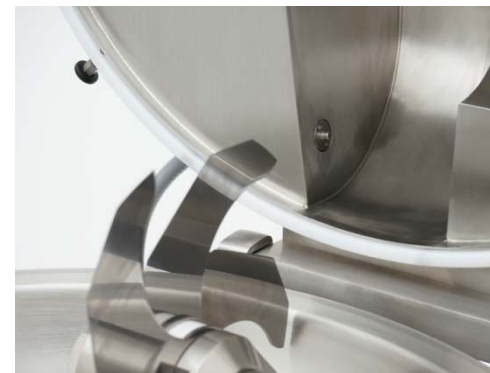
Abnehmbare, selbstanpassende Schüsseldichtung,