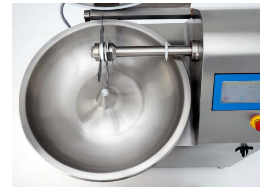
Massive Schüssel aus Edelstahl.